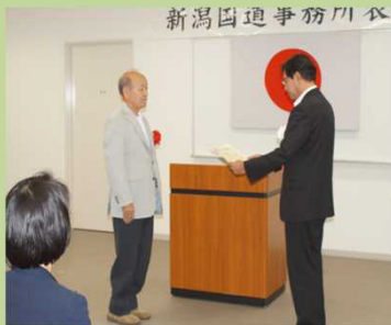
おおどおりにしもえぎのかい 【大通西萌えぎの会】