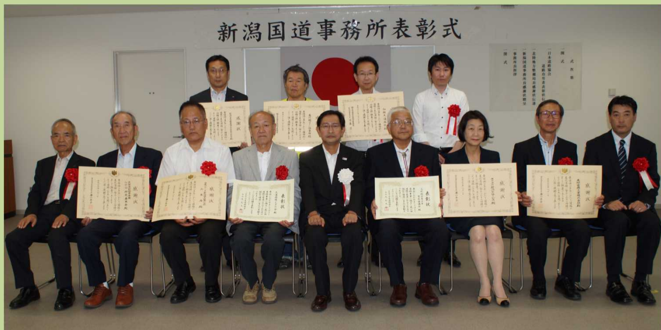
新潟国道事務所表彰式

涼しい風が心地よい気候となり、秋の気配を感じる季節となりました。ボランティア活動も活発になる季節です。皆様方におかれましては、益々ご清祥のこととお喜び申し上げます。