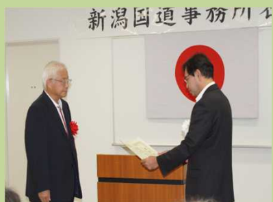
おおがたちくせいしょうねんいくせいきょうぎかい 【大形地区青少年育成協議会】