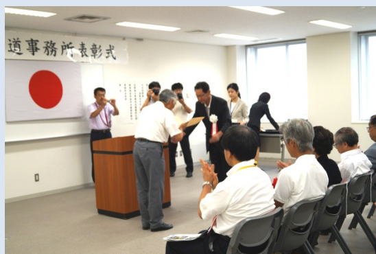
おおしまかみくみかい 【大島上組会】