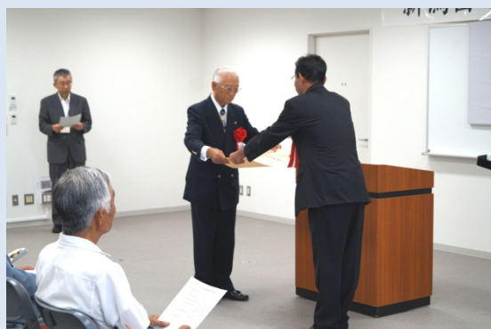
みなと 【にいがた水都ライオンズクラブ】