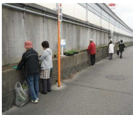
【活動から得られる人とのつながりは心のぬくもりを感じます】

明けましておめでとうございます。女池6丁目地内のバイパス側道の長さ200mの側帯に春秋の年2回色とりどりの花を咲かせ、行き交う人達から「どなたが植えているのですか」、「この道を通るのが楽しくなりました」等々の初対面の方との双方向の会話は爽やかです。以前は数人で個々に手入れをしていましたが、雑草に隠れた部分は格好の「ごみ棚」でした。当自治会の環境美化、緑化活動の一環として平成22年にVSP実施団体として取り組み、近隣事業所の方々から散水の協力も頂くなど、今ではごみ一つ無い通りになりました。ボランティアのメンバーに感謝々々です。