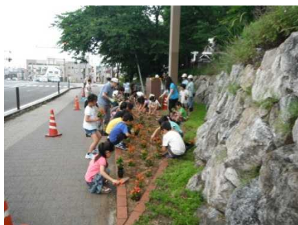
【みんなで楽しみながら活動しています】

新年明けましておめでとうございます。国道116号開通の翌年より学校町通の環境を良くするために、国道沿いの植栽帯の管理を地元の皆さんと取り組んでいます。昨年も関屋小学校と鏡淵小学校の学生さんと桜のたもとの花壇で花の苗を植えました。日々の環境の維持と共に、子供達に花の苗を植えてもらうことで、地元への愛着並びに生命の大切さを理解してもらえることを願って活動を行っています。他、地元学校町通の環境整備を諸官庁へ陳情を行っています。