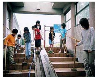
三条市立須頃小学校PTA (三条市)

一般国道7号の新発田市三日市～上館までの0.6kmの区間で歩道の清掃、道路植栽帯へのサルビアやマリーゴールドの植え込み・水やり、除草、ゴミ