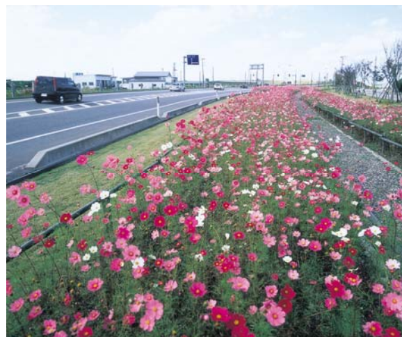
国道49号 阿賀野市コスモスロード

ドライバーや歩行者がそこを通ることで楽しくなり、さらに自分たちの手で育てた花壇の花が地域のPRにつながっていると思うと嬉しくなります。今回ご紹介した2つの道路植栽のような美しいシンボルロードが、これからもいろんな地域で増えて行くと良いですね。