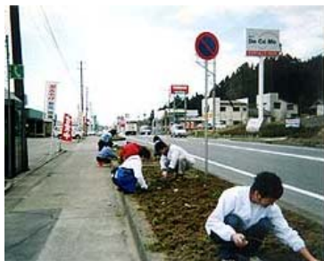
バイパスシティ村上 (村上市)