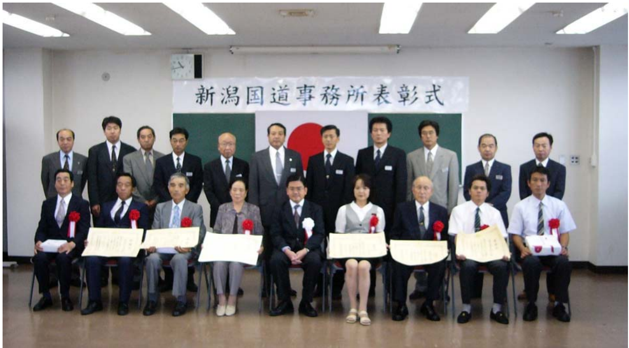
今年度受賞した皆様

今回の表彰式では、管内で活動する5団体・1個人が北陸地方整備局長表彰などの表彰を受けました。