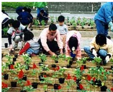
加治地区まちづくりをすすめる会 (新発田市)

一般国道7号、村上市本町地先の0.1kmの区間で歩道の清掃、道路植栽帯への花の苗の植え込み、水やり、除草、ゴミ拾