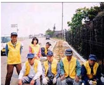
大島上組会 (三条市)

一般国道7号の荒川町下鍛冶屋～藤沢までの0.7kmの区間で歩道の清掃、道路植栽帯へのクロッカスや水仙の植え込み、水やり、除草、ゴミ拾いを行っています。