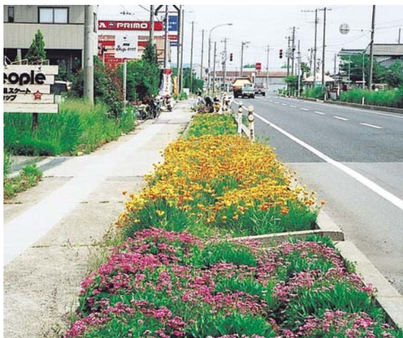
国道116号 吉田町フラワーロード