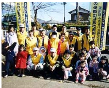
荒川町ふれあい広場実行委員会 (荒川町)