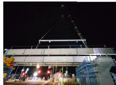
鏡交差点付近の橋梁上部架設状況 (令和8年5月20日撮影)