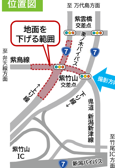
栗ノ木バイパス下り線から見た紫竹山交差点(紫鳥線方向)