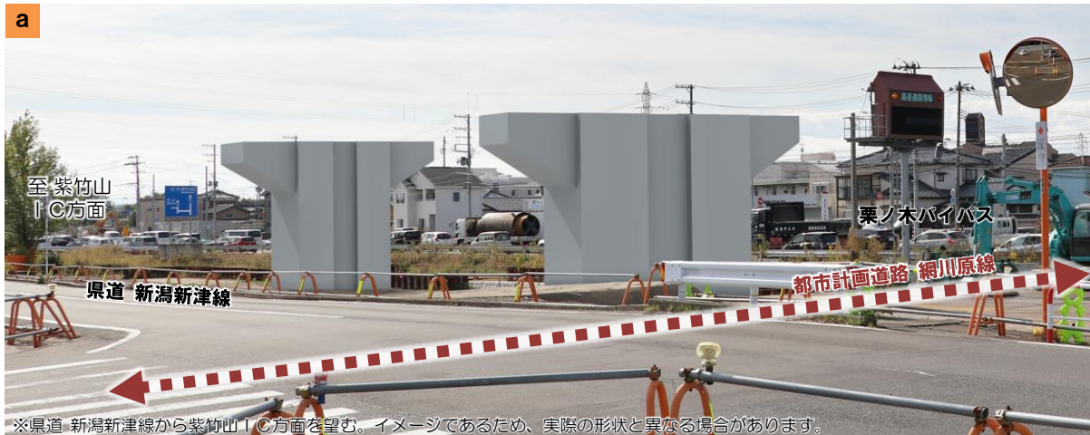
※県道 新潟新津線から紫竹山 C方面を望む。イメージであるため、実際の形状と異なる場合があります。