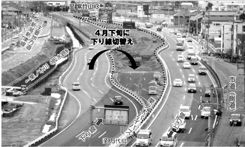
【定点写真】 笹越橋交差点付近から紫竹山IC方向を望む (H29. 2. 22撮影)