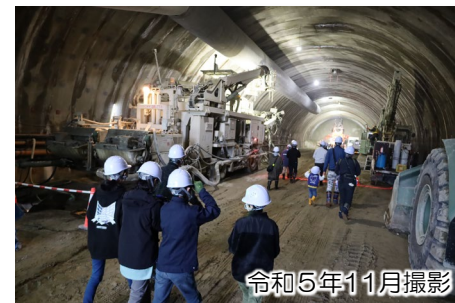
令和5年11月撮影 9号トンネル工事の見学状況