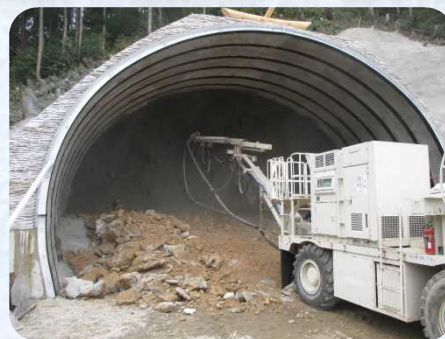
1号トンネルの施工状況(9.11現在)