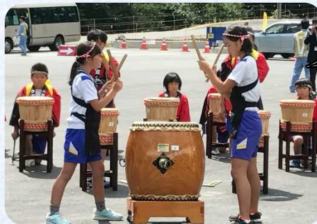
「わかあゆ三面太鼓」演奏の様子

そのほか式典会場では、地元小学校の児童による「わかあゆ三面太鼓」演奏、工事の説明、建設機械に実際にふれあう場面など様々なイベントを行いました。