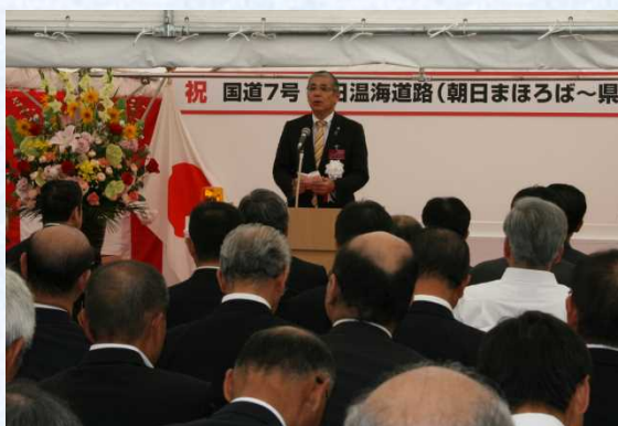
村上市長による式辞