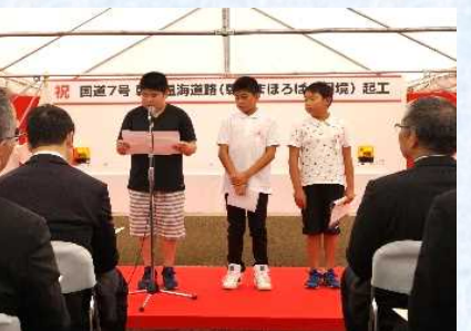
児童による作文発表

そのほか式典会場では、地元小学校の児童による「わかあゆ三面太鼓」演奏、工事の説明、建設機械に実際にふれあう場面など様々なイベントを行いました。