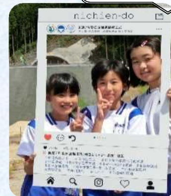
トンネル坑口の記念撮影