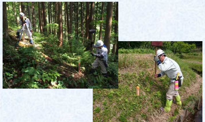
山北地区 用地幅杭設置状況