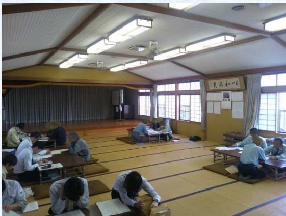
朝日地区 用地買収に向けた説明状況