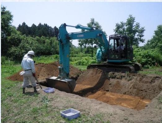
重機による調査 【幅6×4m、深さ約2.5m】