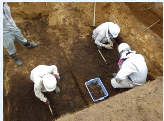
手掘りによる調査