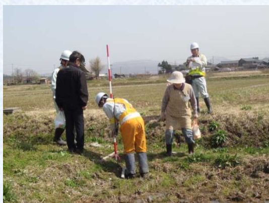
用地調査(境界確認の立会)の状況