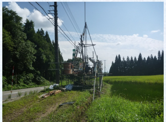
ボーリングの状況