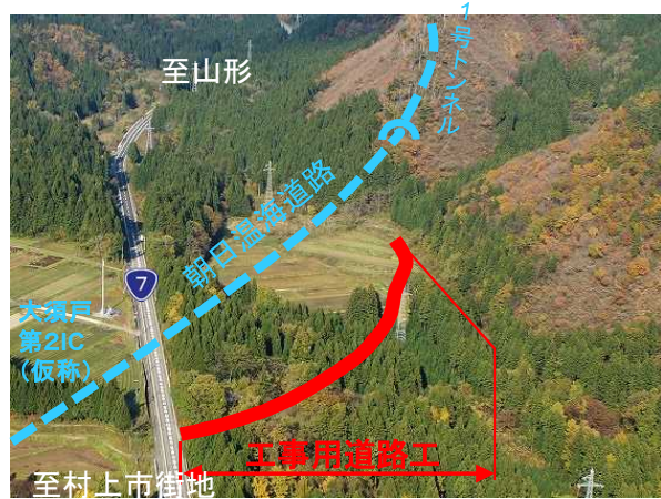
工事用道路整備箇所