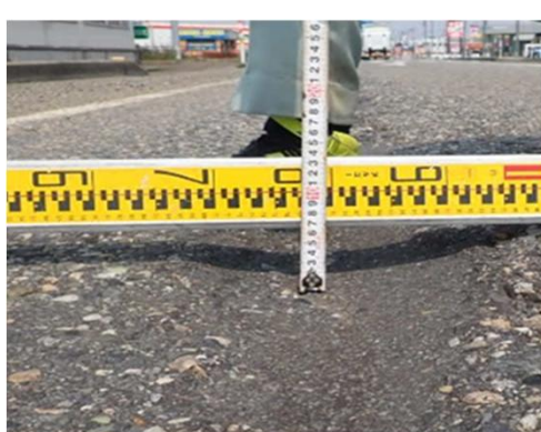
舗装のわだち掘れ