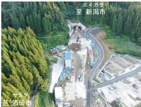
【終点側(山形側)掘削開始地点】