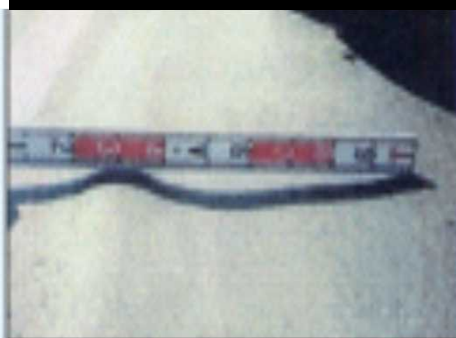
舗装のわだち掘れ