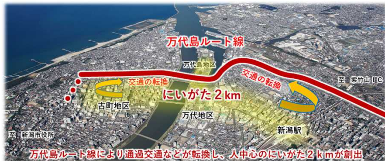
にいがた2kmイメージ