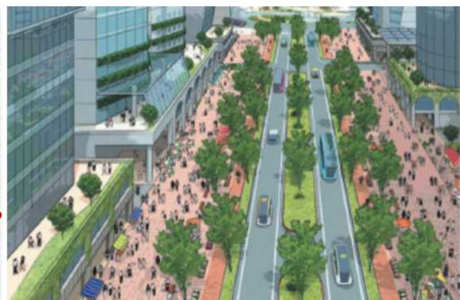
人中心の東大通りイメージ