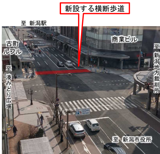
(写真)横断歩道整備前の西堀交差点の状況