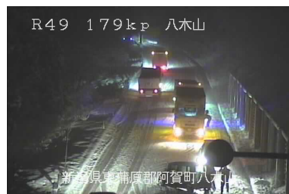
R49 179k p 八木山 山間部で登坂できない大型車両の様子