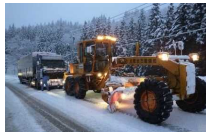
スタック大型車を牽引する除雪車の様子

※取材を希望される方は、11月28日(月)17時までに、下記問い合わせ先までご連絡をお願いします。