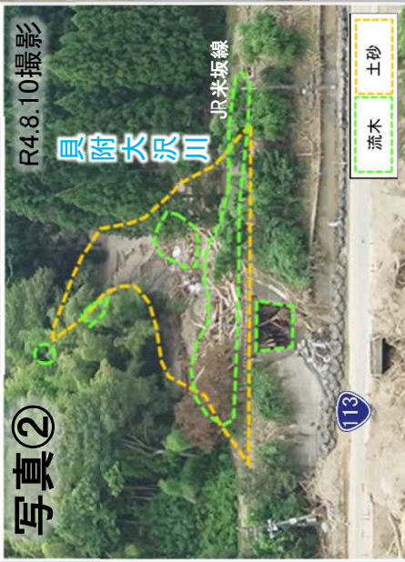
土砂・流木の撤去作業