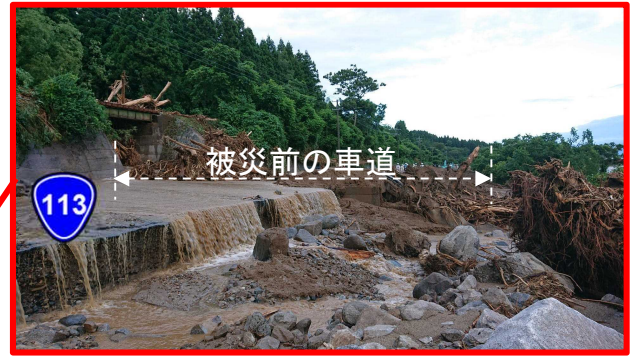
山側からの土砂等流出 (R4.8.5 撮影)