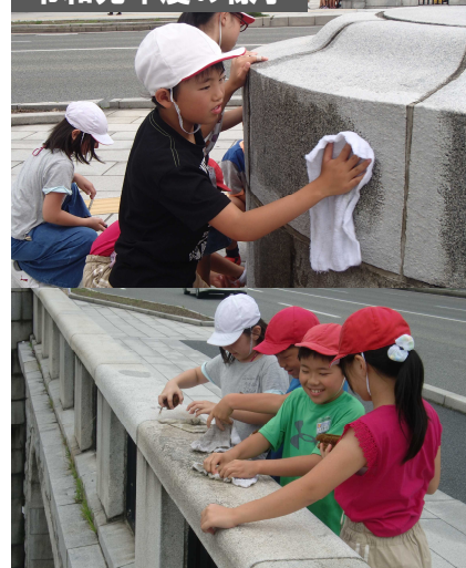
令和元年度の様子

※雨天の場合、当日8時30分までに実施可否を 新潟国道事務所ホームページに掲載します。