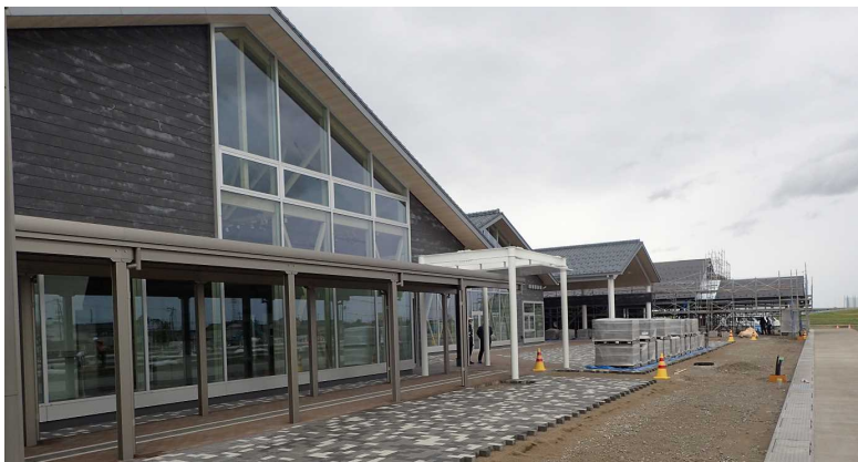
道の駅「あがの」の工事状況(R4. 6. 6撮影)