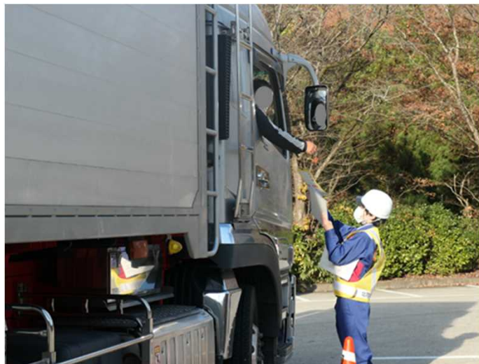
車両誘導訓練及び啓発活動の様子