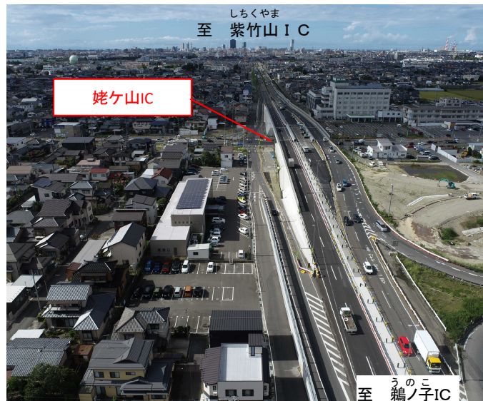
姥ヶ山IC 現在の状況