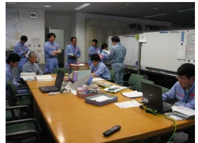
昨年度の訓練状況

※上記日程等の詳細については、下記までお問い合わせ下さい。なお、災害等により、新潟国道支部が注意体制以上を発令した場合は、訓練を中止します。