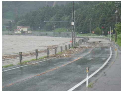
H16.7.17荒川が増水し、R113関川村金丸地先の道路が冠水