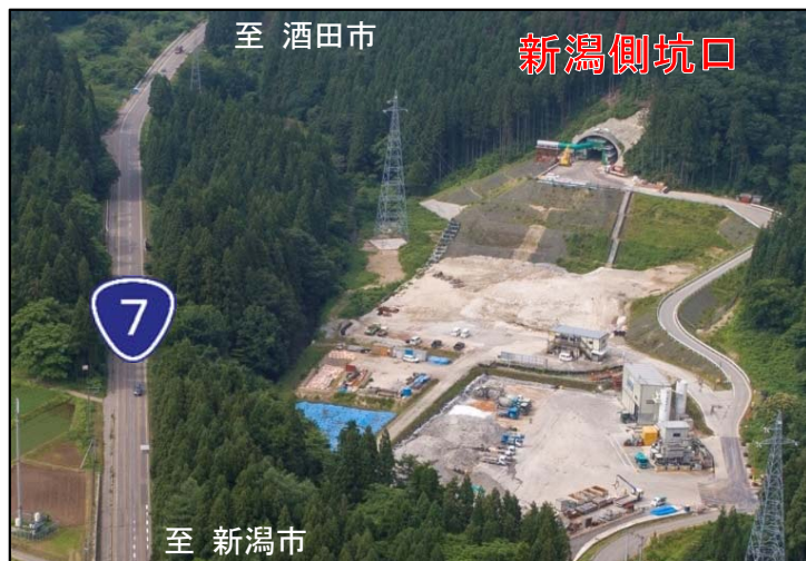
【起点側（新潟側）掘削開始地点】