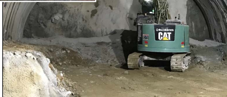
【貫通時の状況（新潟側）】