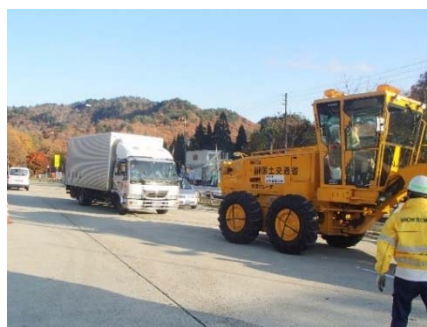
大型車両の牽引訓練の様子