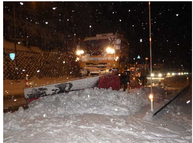
除雪トラック(阿賀町 ふくとり 福取地先)