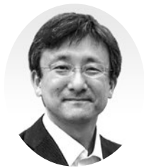
大江 真弘 北陸地方整備局 新潟国道事務所長

1960年北海道生まれ。1985年建設省(現国土交通省)入省。福岡市土木局長、国土交通省都市・地域整備局街路交通施設課整備室長、鹿児島市副市長、独立行政法人都市再生機構都市再生部全国まちづくり支援室長などを経て、2015年より現職。