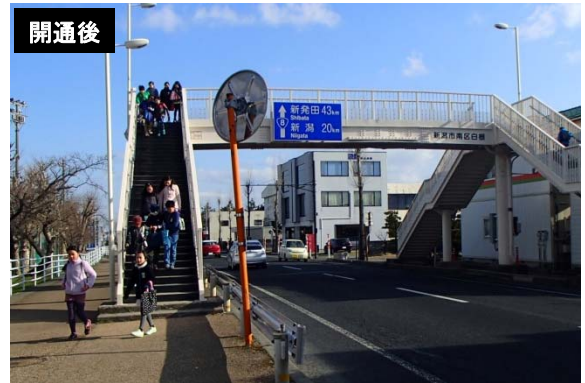
写真2 開通後は大型車をはじめ交通が減少(国道8号:白根小学校前)