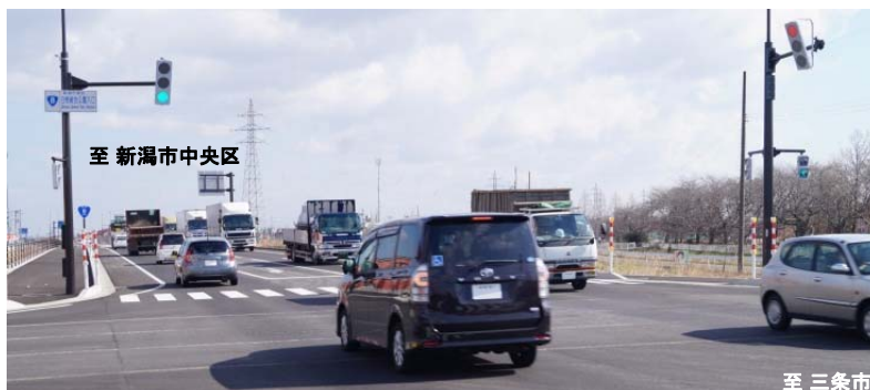
写真3 大型車をはじめ交通が大きくシフト(白根バイパス:白根総合公園入口交差点)