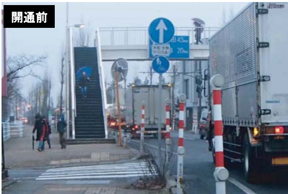
写真1 開通前は市街地に交通が集中(国道8号:白根小学校前)