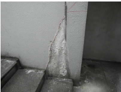
橋詰め階段壁面(ひび割れ、漏水)