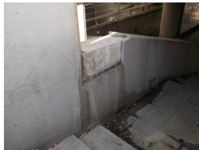
橋詰め階段壁面(浮き)