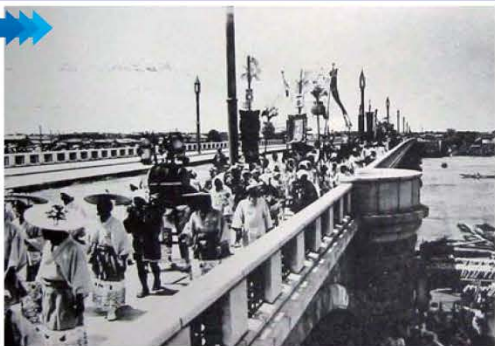
三代目萬代橋の渡り初め