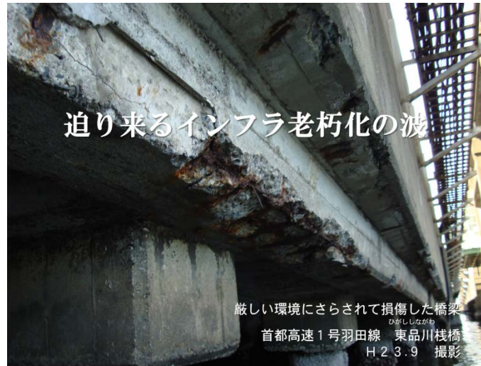
老朽化パネルより

厳しい環境にさらされて損傷した橋梁 ひがししながわ 首都高速1号羽田線 東品川栈橋 H23.9 撮影