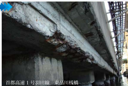
厳しい環境にさらされて損傷した橋梁