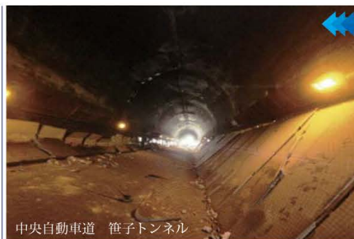
トンネル天井版の落下事故