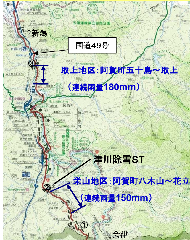
交通遮断機操作訓練箇所 ①福取駐車帯 ②津川除雪ST ③取上駐車帯