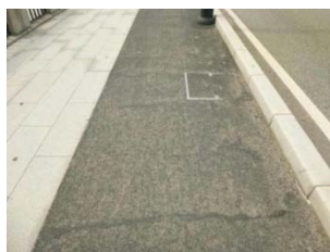
歩道の損傷 (ひび割れ、段差)