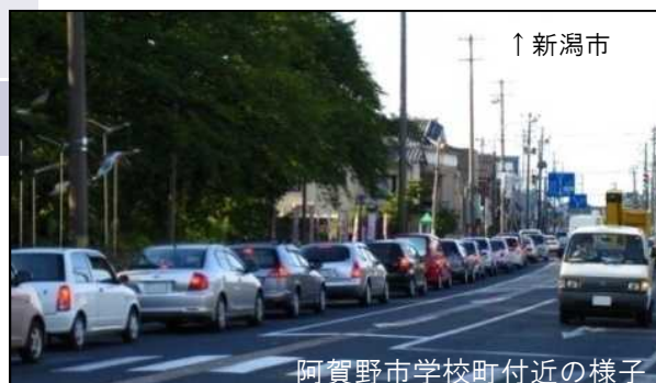
阿賀野市学校町付近の様子