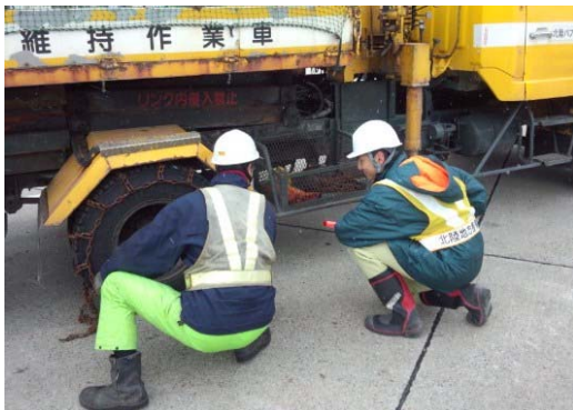
チェーン装着方法の確認