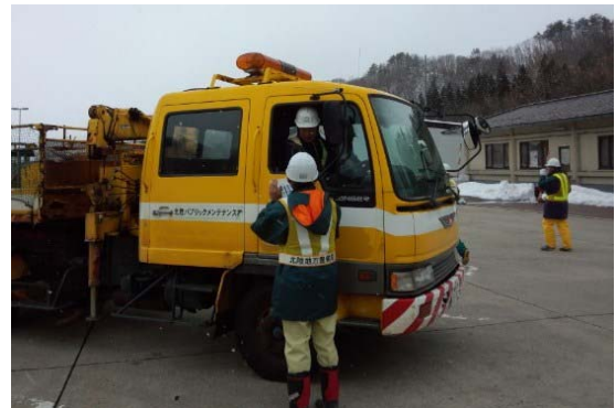
ドライバー指導シュミレーション