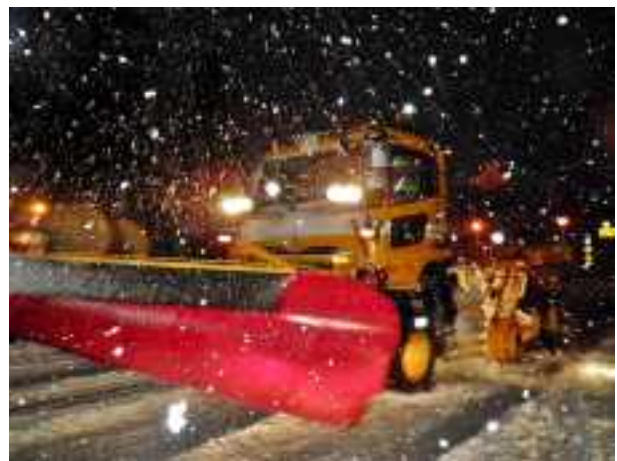
除雪車初出動の様子 (国道49号阿賀町八木山地先(福島県境付近))

○今回の除雪作業では、除雪車2台(除雪グレーダ1台、除雪トラック1台)が出動し、阿賀町内の国道49号約17kmを除雪しました。