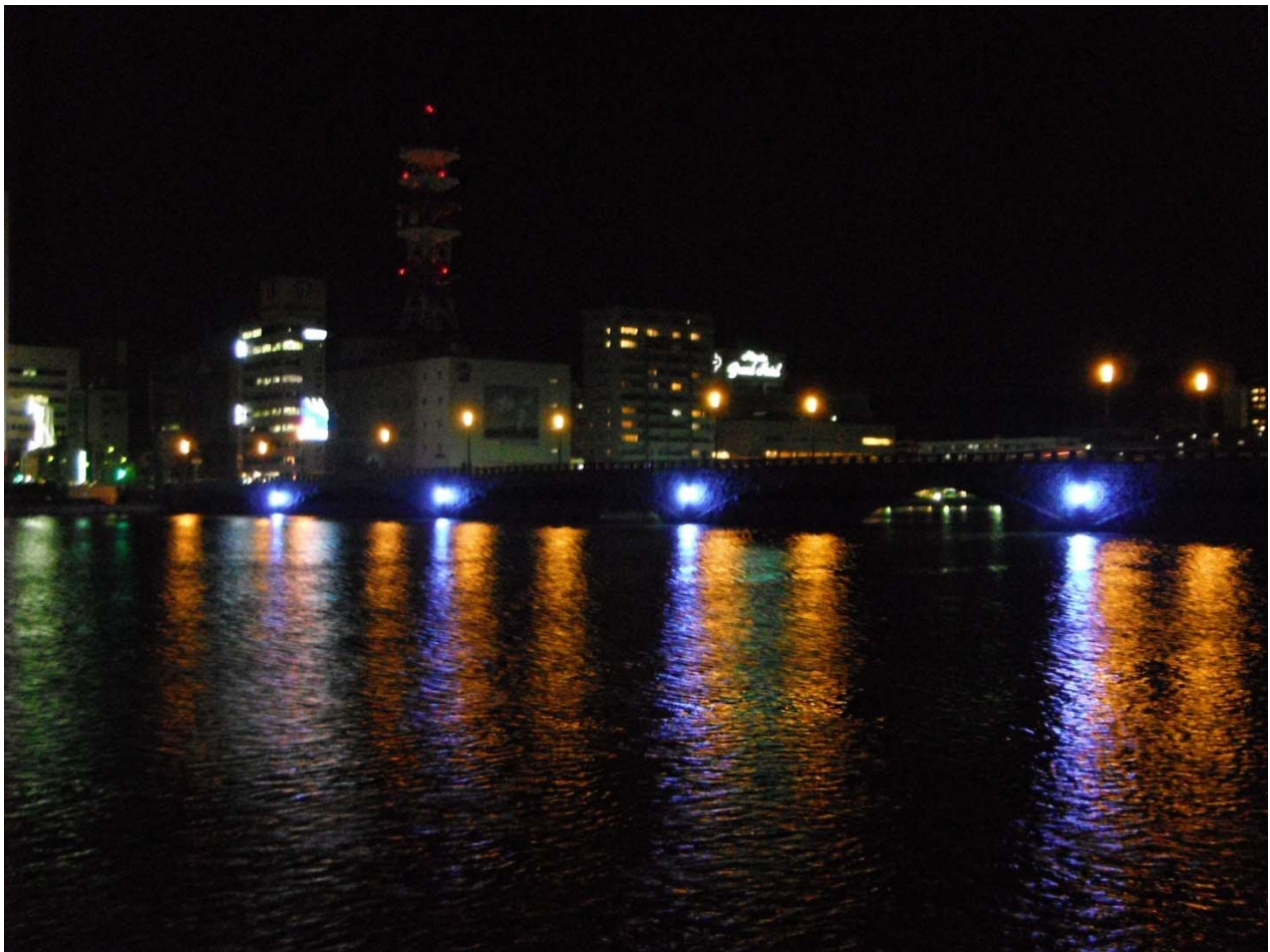
ライトアップ点灯の様子（平成24年11月9日撮影）