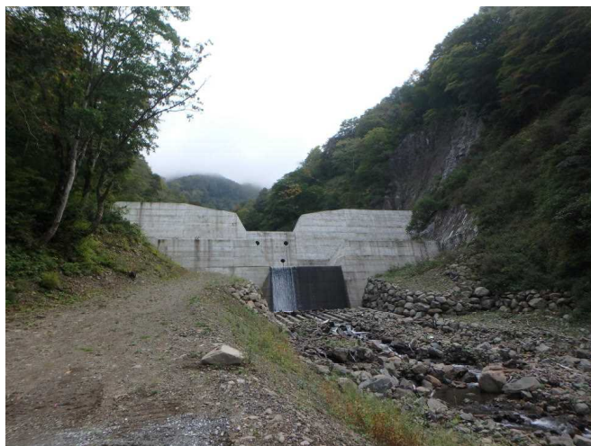
【参考】中股川第3号堰堤完成(令和2年10月撮影)

主催： 一級水系根知川流域直轄砂防事業促進期成同盟会(糸魚川市・小谷村) 国土交通省北陸地方整備局松本砂防事務所