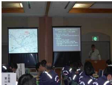
司会進行役が災害状況(シナリオ)を説明しながら訓練参加者に質問