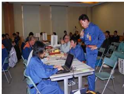
指名された機関が状況を踏まえて対応すべき行動を口頭で回答