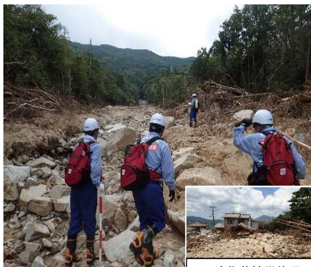
溪流の状況を確認[東広島市黒瀬地区]