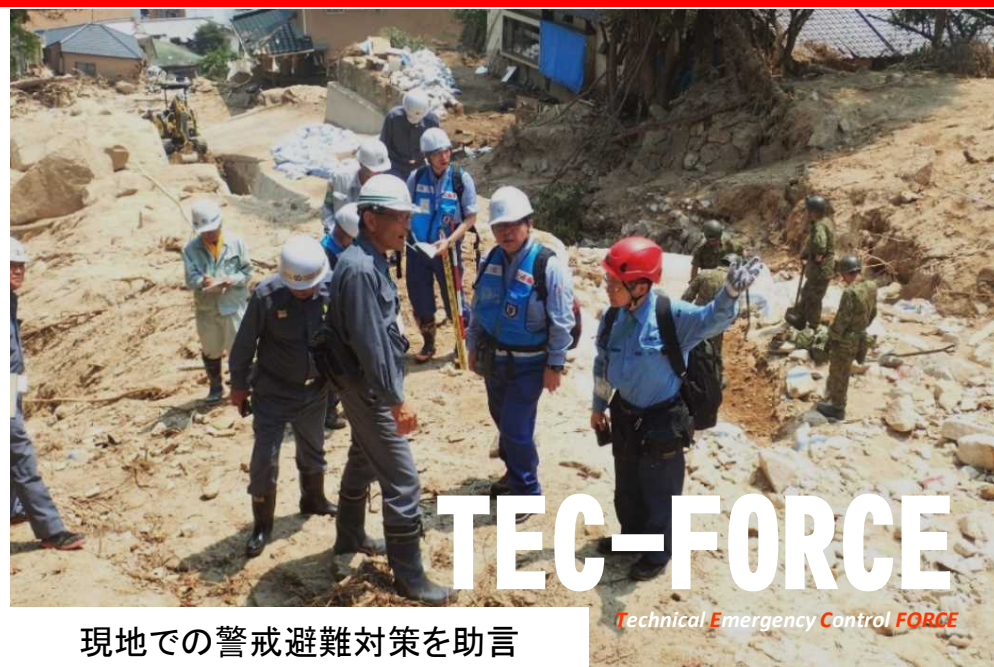
現地での警戒避難対策を助言