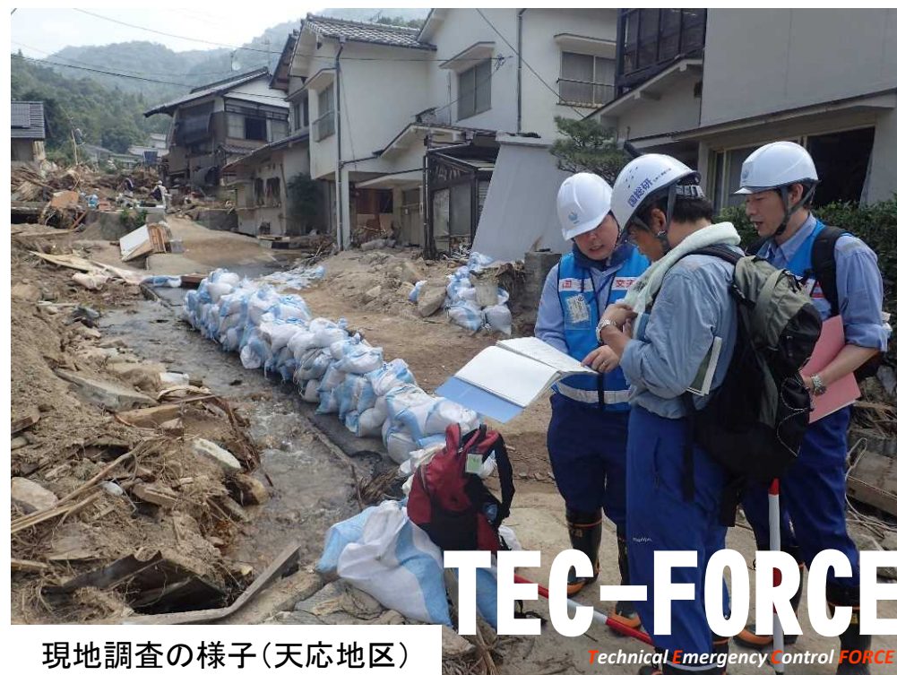
現地調査の様子(天応地区)