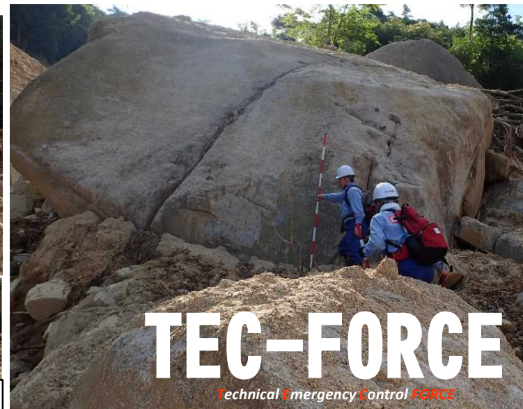
大転石の安定度を確認(熊野町川角地区)