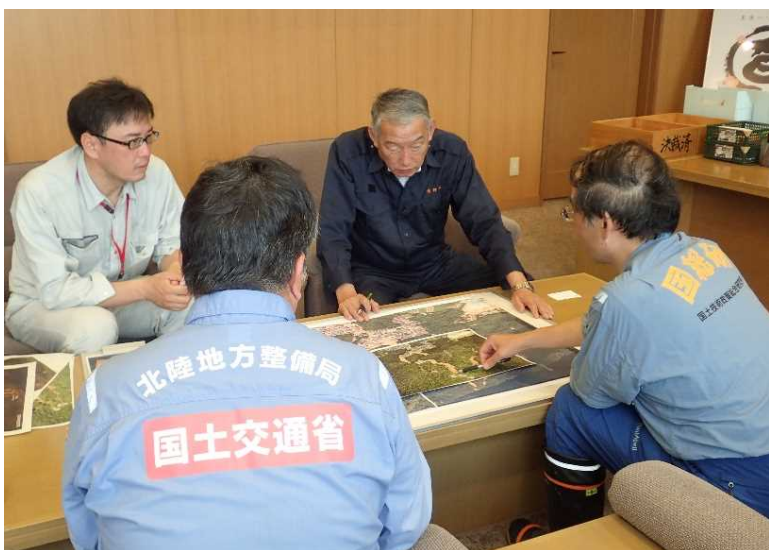
熊野町長へ現地状況を踏まえ避難計画の助言

⇒ 国土技術政策総合研究所 桜井 研究官とともに、土砂災害の警戒避難対策の助言を実施！