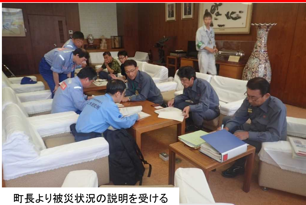
町長より被災状況の説明を受ける