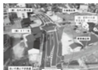
事業完成後の状況(令和5年3月) ▶P.11