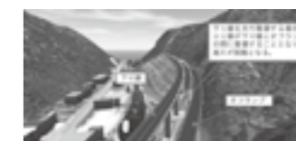
供用開始順の検討▶P.22