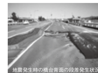
地震発生時の橋台背面の段差発生状況 地震時の段差写真▶P.32