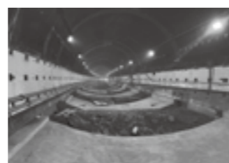
先行施工のインバート設置状況 ▶P.13