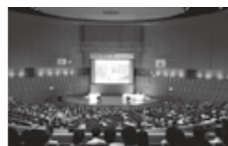
富山国際会議場メインホール▶P.9