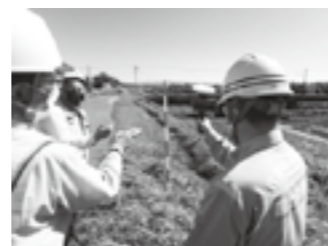
AR画像での立会状況▶P.15