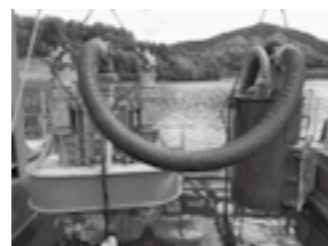
オーガ付吸引機と 中継ポンプユニット▶P.17