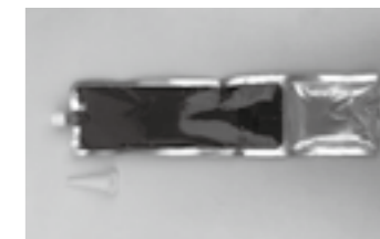
開発品『スーパーMDシール』外観 ▶P.93