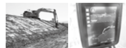
MCバックホウによるICT施工 ▶P.91