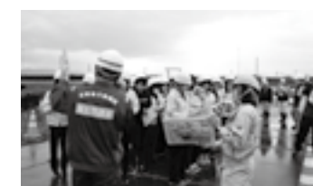
平成30年度 女子学生と女性技術者 による現場見学会▶P.17