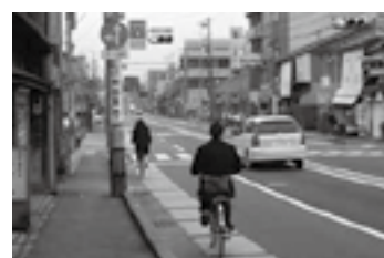
自転車走行指導帯▶P.5