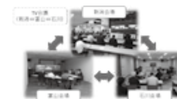
令和元年度北陸ブロック 発注者協議会の開催▶P.15