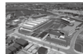
石川運輸支局(16) 建築その他工事 (2018年竣工)▶P.19