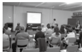
県政出前講座の開催状況▶P.9