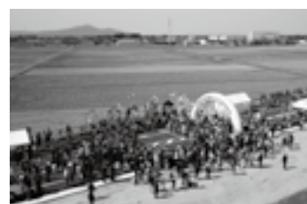
開通式典の様子 (テープカット・バルーンリリース) ▶P.3