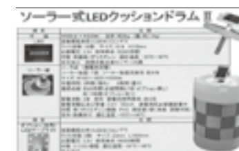
ソーラー式LEDクッションドラムⅡ ▶P.22

「北陸の建設技術」への意見、ご感想がありましたらお聞かせください。 E-mail:hokugi@hrr.mlit.go.jp