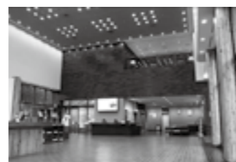
エントランスホール▶P.5