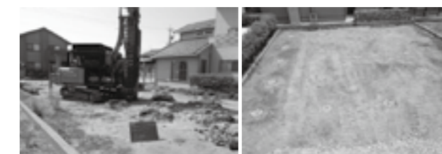
スクリュー・プレス工法-砕石パイル-▶P.17

「北陸の建設技術」への意見、ご感想がありましたらお聞かせください。 E-mail:hokugi@hrr.mlit.go.jp