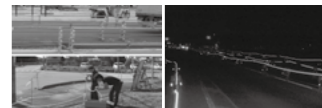
全天候型広角度対応反射ロープ▶P.17