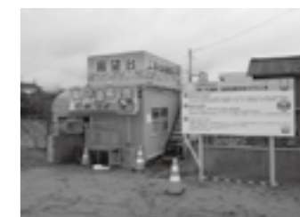
コミュニティBOX外観▶P.19