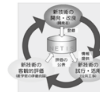
新技術活用システムのイメージ図 ▶P.17