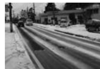
アイストールの凍結抑制効果 ▶P.17

「北陸の建設技術」への意見、ご感想がありましたらお聞かせください。 E-mail:hokugi@hrr.mlit.go.jp