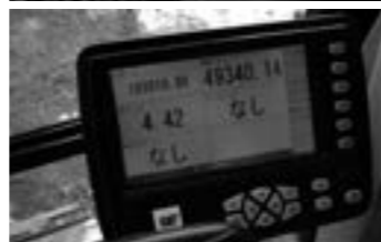
既知点、バケット位置座標照合状況 ▶P. 7