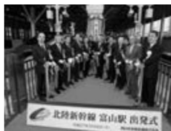
富山駅 出発式 ▶P. 3