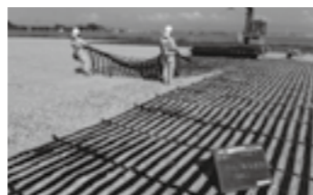
敷網工(パラリンク) ▶P. 5