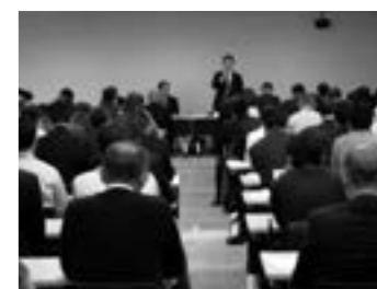
運用指針説明会開催状況(新潟会場) ▶P.13